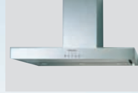
WH EFC9870 WH EFC9850