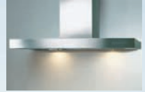
WH EFC9830.2 WH EFC9810.2