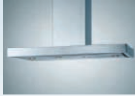
IH EFC9770 IH EFC9750