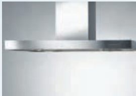
IH EFA9740.3 (nur Abluft) IH EFA9730.2 IH EFA9725.2