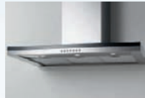
WH EFC9422 WH EFC6422